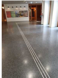
Foyer in der Ebene 0