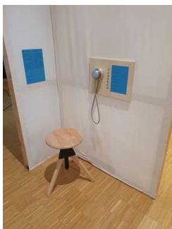
Hörstation im Ausstellungshaus