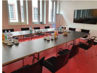
Tagungsraum im roten Flur (Ebene 2)