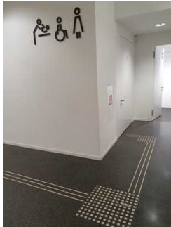
Foyer in der Ebene 0