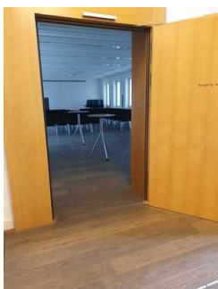
Tür zum Sonnemann-Saal (Ebene 1)