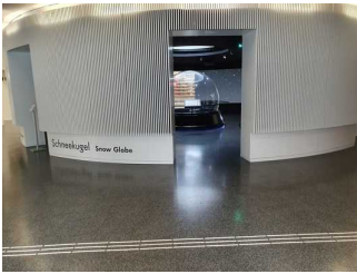
Foyer in der Ebene 0