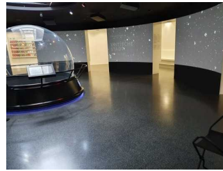
Foyer in der Ebene 0