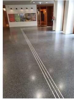
Foyer in der Ebene 0