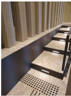
5 Stufen auf Ebene 2