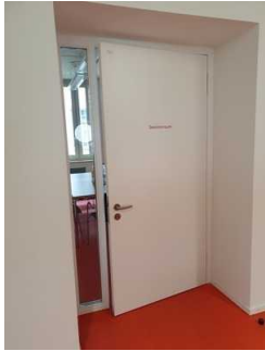
Tür zum Tagungsraum im roten Flur (Ebene 2)