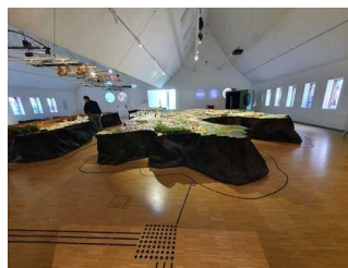
Frankfurt-Modell auf Ebene 3