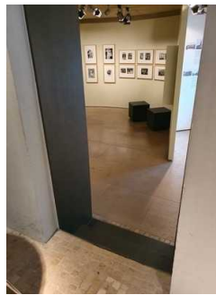
3 Stufen auf Ebene 4