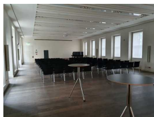
Sonnemann-Saal (Ebene 1)