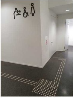
Foyer in der Ebene 0