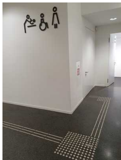
Foyer in der Ebene 0