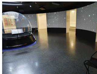
Foyer in der Ebene 0