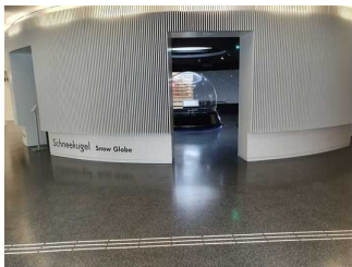
Foyer in der Ebene 0