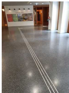
Foyer in der Ebene 0