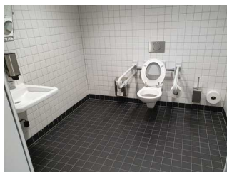
WC für Menschen mit Behinderung (Ebene 0)