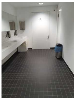
WC für Menschen mit Behinderung (Ebene 0)