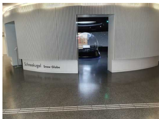
Foyer in der Ebene 0